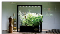
Eco Herb PMF-M10