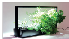
Mini Plantfactory PMF-M20