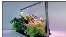
Mini Plantfactory PMF-M30

e-mail: info@venso.se Hemsida: venso-ecosolutions.se